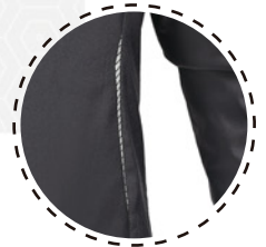
REFLECTANTES EN ESPALDA

Nuestra PARKA RALCO con excepcional capacidad de abrigo sin ser pesado ni voluminosa. Con buen nivel de repelencia y transpirabilidad.