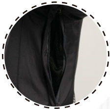
VENTILACIÓN CON CIERRE Y MESH